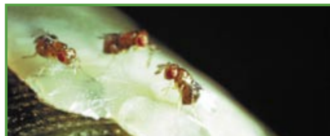
Lutte biologique directe